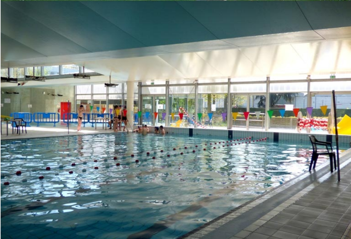
^ La piscine en 2015