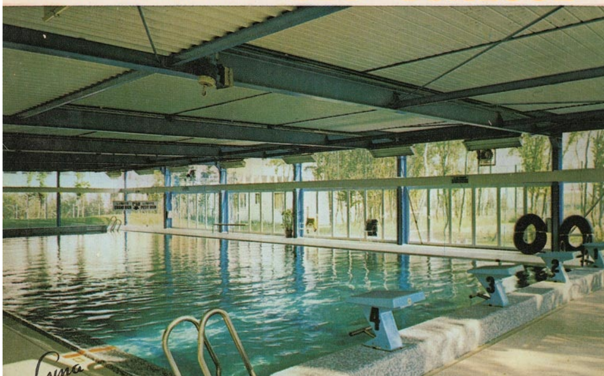
^ La piscine dans les années 1970