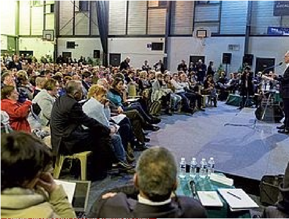
CINEMA JACQUES TATI, COLLEGE ROMAIN ROLLAND,