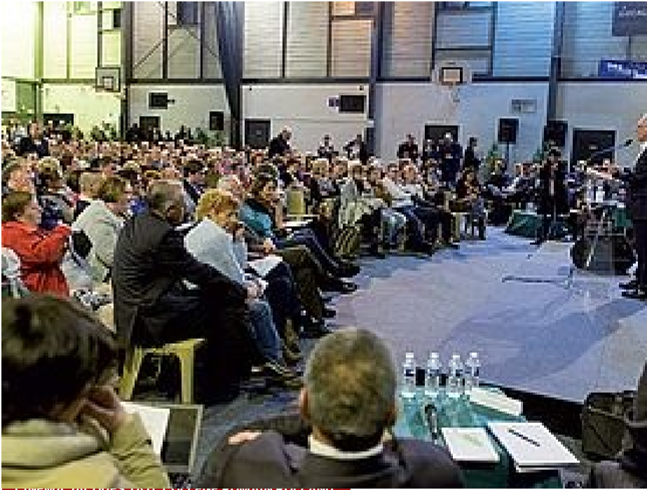
De nouveaux projets pour le Vert-Galant